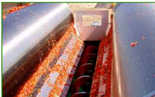
Рис. 1. Барабанное сито