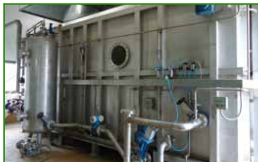
Рис. 2. Флотационная установка

является практически безальтернативным решением, сочетающим в себе высокую гидравлическую нагрузку, компактность и эффективность очистки.