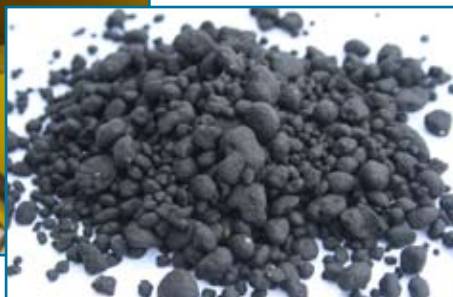
Высушенный осадок в виде гранулата

К контейнеру примыкает отсек обслуживания, в котором расположено вентиляционное оборудование, теплообменники и система управления. Установка не требует отдельного здания и может быть расположена снаружи. Для размещения компактной модульной конструкции достаточно площади 40 м 2 .