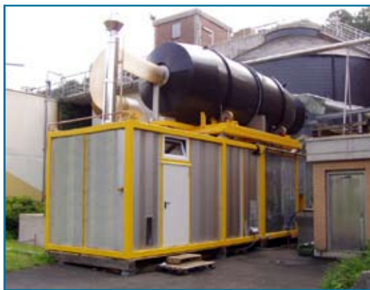
Сушильная установка Combi-Dry

Предварительно подсушенный осадок путём опрокидывания барабана сбрасывается в расположенный ниже контейнер для оконча-