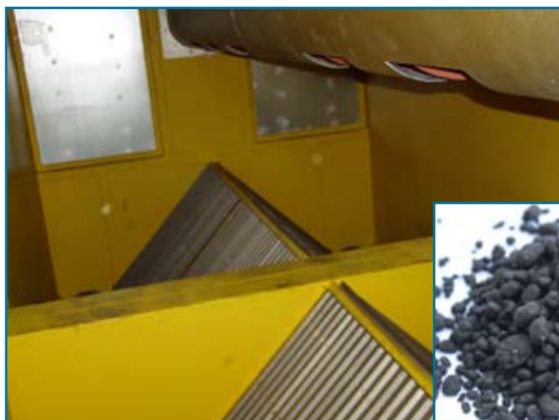
Внутреннее устройство контейнера досушивания